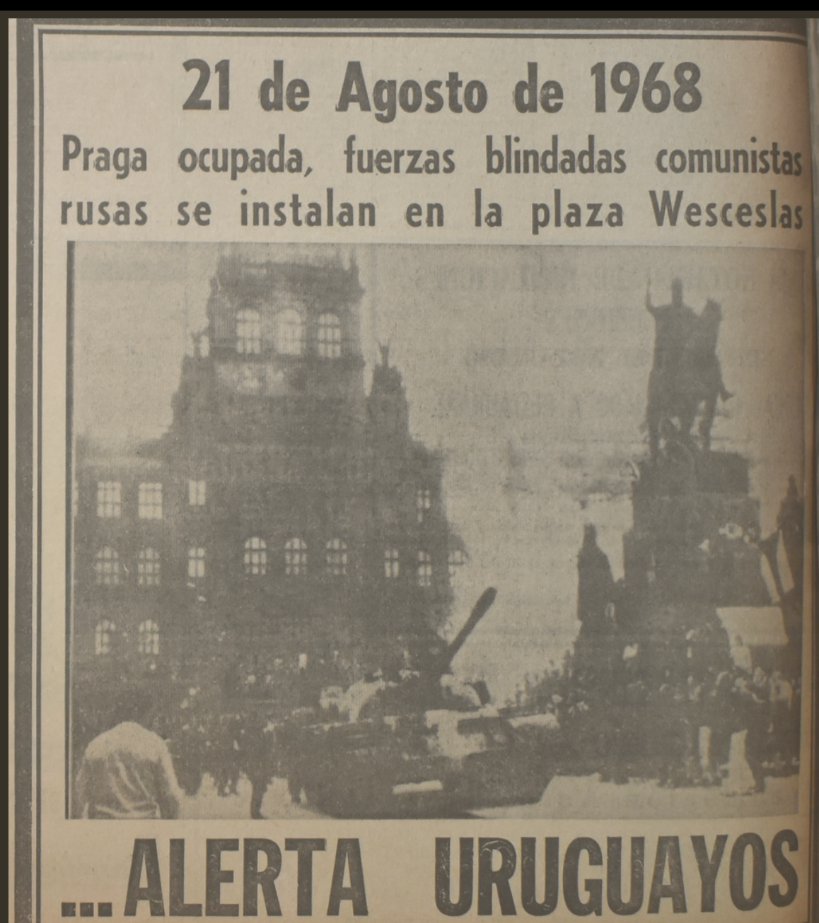
La Mañana 12/11/1971

En el transcurso de las dos últimas semanas del mes los diarios oficialistas publicaron una serie compuesta por una decena de piezas publicitarias agrupadas bajo el letemotiv "Alerta uruguayos". Siguiendo un patrón reiterado en distintos países del mundo, en Uruguay venían circulando por décadas informaciones, representaciones e imágenes sobre la URSS y los países del bloque socialista como escenarios de miseria, violencia, desestructuración social y falta de libertades. En 1971 estas representaciones recobraron intensidad y sirvieron para asociar a la coalición de izquierdas con el comunismo y sus derivas negativas.