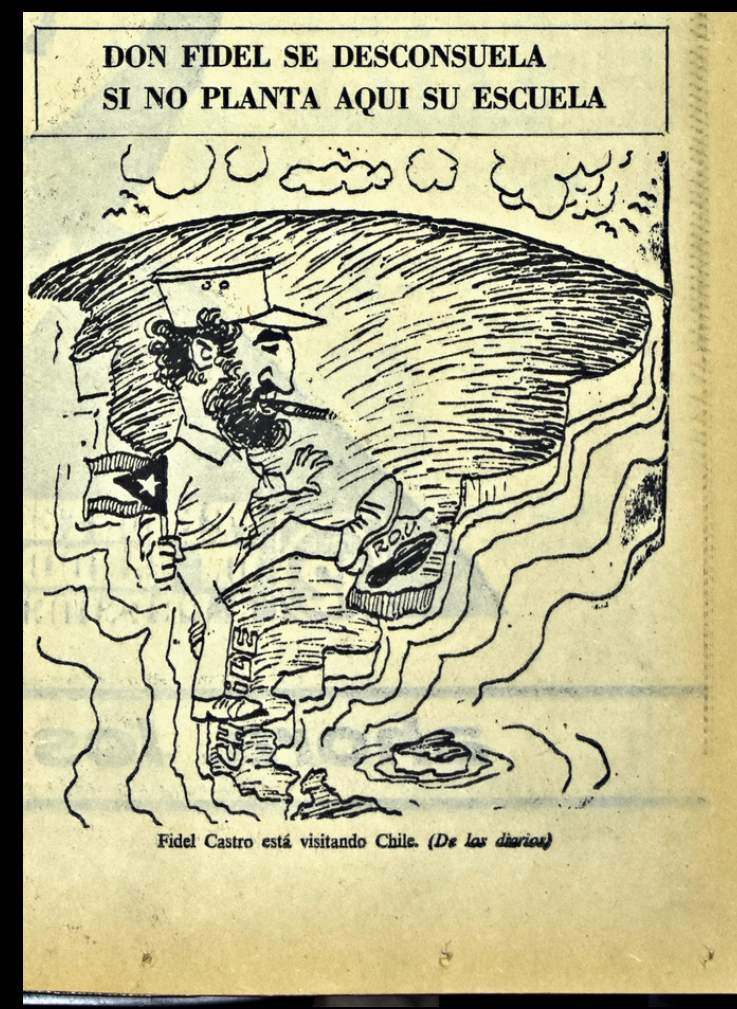
El Diario, 11/7/1971