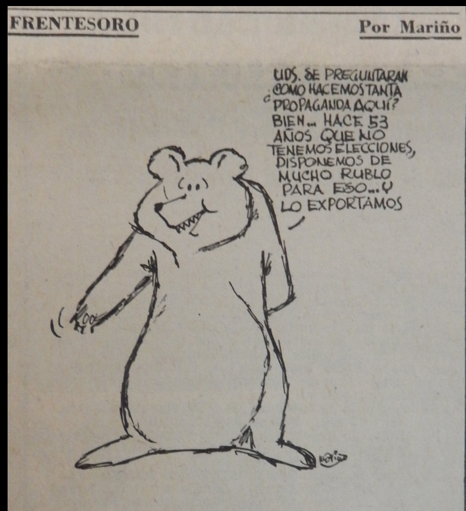
El País, 6/6/1971

La derecha siguió de cerca el proceso revolucionario cubano, primero con escepticismo y desde 1961 -año en que el gobierno de Fidel Castro abrazó públicamente el comunismo- con un rechazo militante. Especialmente en América del Sur la “conversión” cubana no fue vista solo como un nuevo mojón del expansionismo soviético. Era además, y sobre todo, la concreción de un profundo temor; la prueba de que el comunismo había alcanzado el continente americano y su siguiente desafío sería avanzar hacia el sur. “Ayer Hungría. Hoy Cuba. ¿Mañana será Uruguay? No pasarán”, declaraban varias organizaciones anticomunistas representativas de esta visión. Desde entonces, movimientos sociales, partidos, gobiernos y medios de comunicación con sensibilidad anticomunista acusaron al régimen liderado por Fidel Castro de brindar apoyo logístico, ideológico y financiero a partidos y organizaciones de izquierda latinoamericanas.