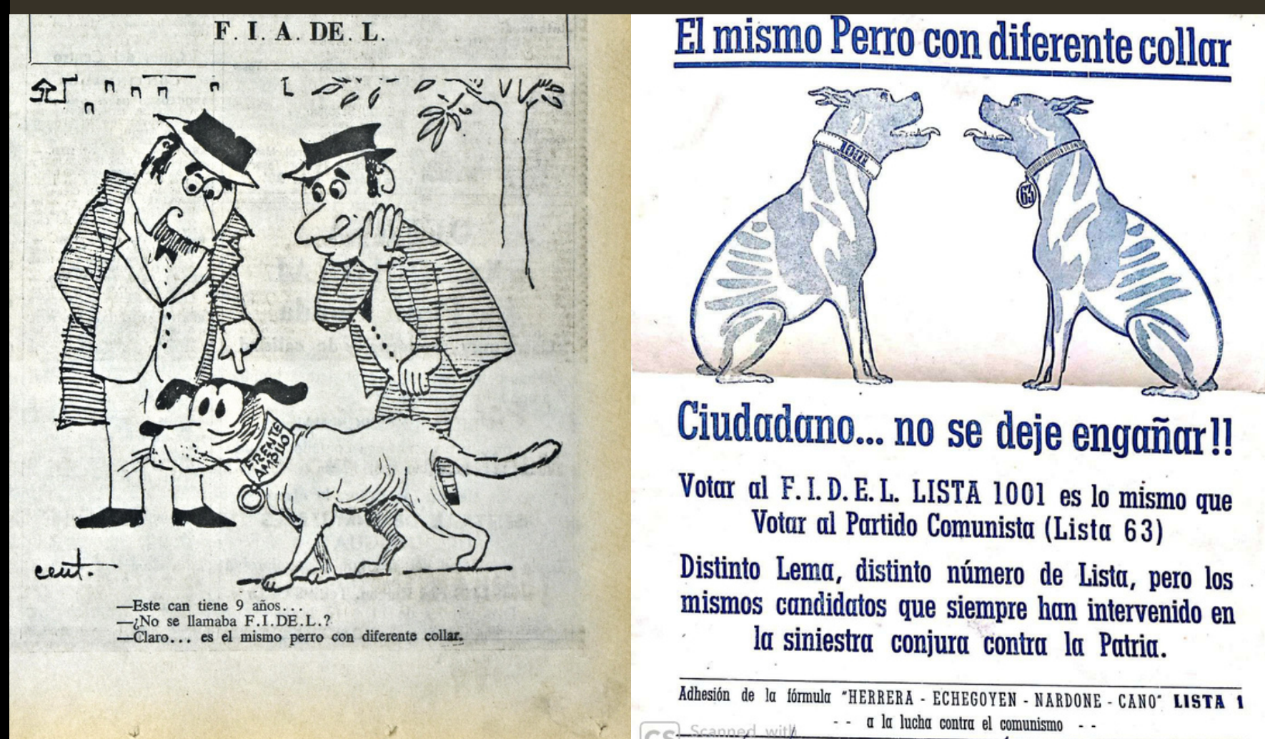
El Diario, 14/11/1971 y volante correspondiente a las elecciones de 1962

En varias oportunidades los diarios oficialistas publicaron reproducciones facsimilares del periódico comunista El Popular, documentando estrechos vínculos entre el partido comunista de Uruguay y el de la URSS. Esa fácil asociación no dejaba lugar a dudas: el PCU era una extensión soviética que había logrado aliados en su proyecto antinacional. Asimismo, se buscó establecer un vínculo de continuidad entre el frente impulsado por los comunistas en 1962 (Fidel) y el Frente Amplio. Se apeló a la expresión popular de “un mismo perro con otro collar”, que tenía ya antecedentes en el repertorio anticomunista.