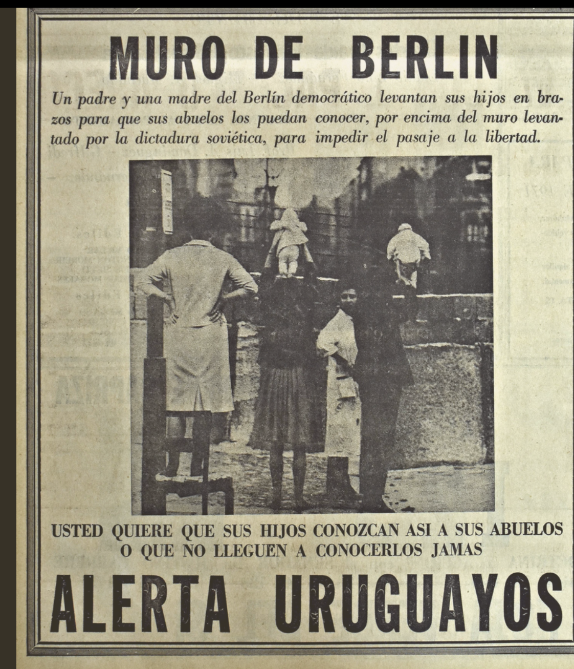
El Diario 20/11/1971

Las fotografías usadas en la campaña documentaban situaciones de opresión, violencia y desintegración familiar en Checoslovaquia y Alemania Oriental, dos importantes enclaves del bloque socialista. Uno de los tópicos recurrentes en la propuesta visual fue la represión soviética en Praga, en agosto de 1968, cuando se sofocó la movilización popular que cuestionaba la falta de libertades políticas. En primer plano figuran tanques militares que se abren paso entre los manifestantes, reforzando la sensación de desproporcionalidad de la represión comunista.