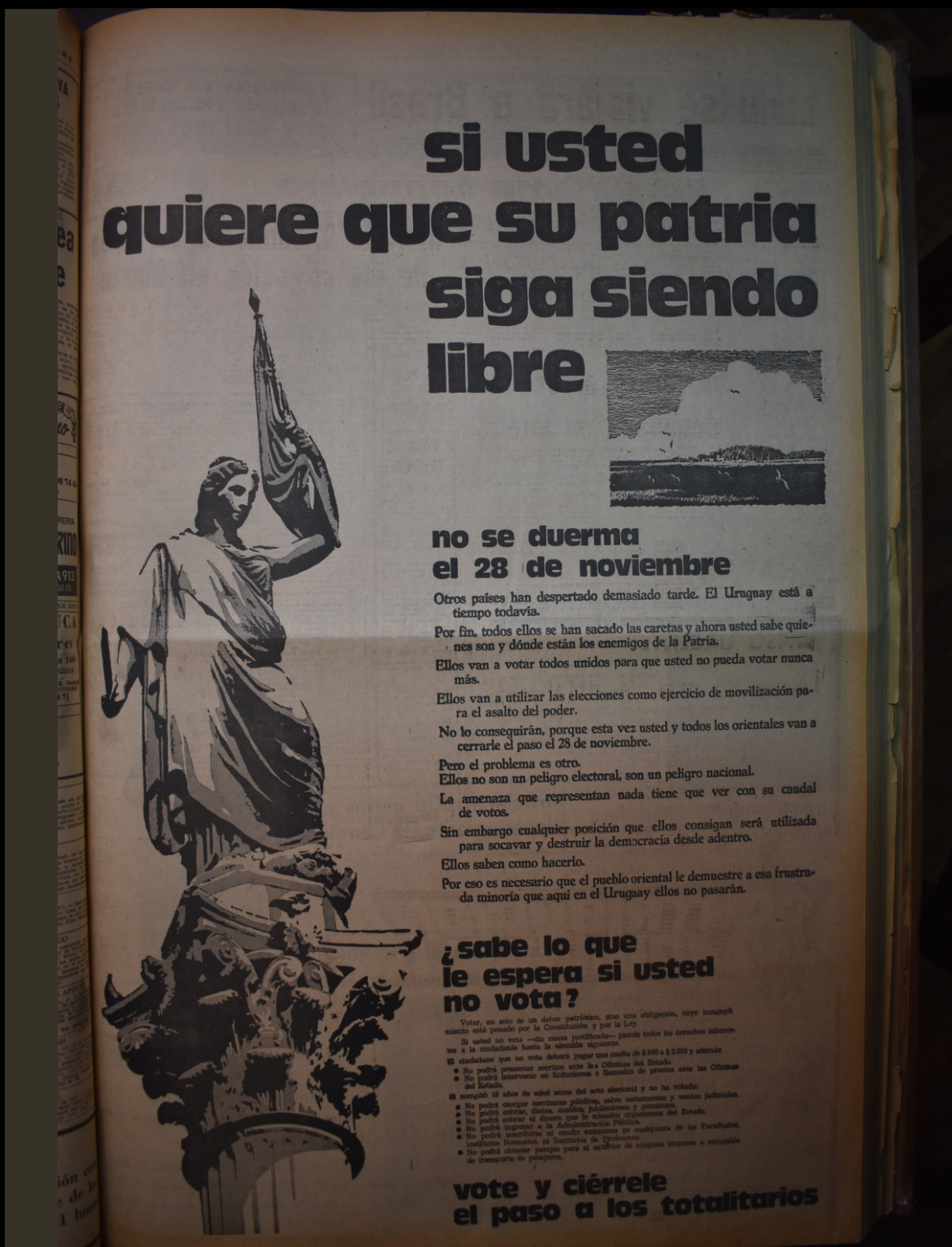
La Mañana, 14/11/1971

Si bien buena parte de la campaña mediática se sostuvo sobre la base de imágenes y textos que demostraban un avance escalonado del comunismo desde Cuba hacia Chile con rumbo a Uruguay, ese derrotero no se planteó como una fatalidad. Otras piezas propagandísticas tuvieron como objetivo ofrecer una estrategia para impedir el tan temido desenlace. El mensaje, en este sentido, apuntó a presentar el voto ciudadano como la mejor arma de lucha. La insistencia en el voto reforzaba la antinomia democracia/totalitarismo, contribuyendo a recordar las penurias de la vida en los países socialistas.