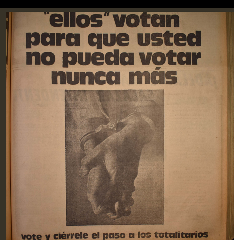
El País, 21/11/1971

Pocos días después, la imagen que acompañaba el mismo letemotiv a propósito de la uso perverso que los izquierdistas hacían del voto mostraba dos manos encadenadas con una inscripción sencilla que convocaba a votar para “cerrar el paso” a los totalitarios. En la parte superior del anuncio se exponía de manera literal la idea de avance regional de un peligro global: “Empezaron en Cuba. Llegaron a Chile donde ya están pidiendo paredón. Y aquí dijeren que ahora le toca al Uruguay. Ellos votan para que usted no pueda votar nunca más. Quieren aumentar su representación parlamentaria para destruir al Parlamento. Quieren apoderarse del Municipio de Montevideo para aterrorizar a la ciudad. Quieren confundir los gremios, para esclavizar después a los trabajadores, liquidando o ‘amansando’ a sus líderes sindicales. Quieren utilizar a los estudiantes como carne de cañón de sus brigadas, para secar después con la metralla cualquier auténtica rebeldía juvenil. Quieren valerse de los intelectuales para suprimir seguidamente la libertad de pensamiento. Quieren escudarse detrás de las mujeres, de los ancianos, de los niños, para separar a las madres de sus hijos, para convertir a los adolescentes en ‘soplones’, para abandonar a los viejos que no producen. Quieren lisa y llanamente la esclavitud del partido único. Para ellos la ‘vía electoral’ es tan sólo uno de los caminos para el asalto al poder. [...] Ellos saben cómo hacerlo. Para eso han sido entrenados en el extranjero.”